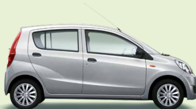
Gris clair Métal (S28)

» Que ce soit avec un laquage métallisé* gris clair et noir ou avec le laquage standard blanc ou rouge, dans nos couleurs attrayantes, vous attirerez toujours les regards admiratifs et les « Waw ! » émerveillés. Choisissez votre couleur préférée pour votre Cuore et prenez vos aises. Et ne soyez pas contrarié si à la place d'un « Waw ! » vous entendez également des « Regarde ! » ou « Je veux la même ! ».