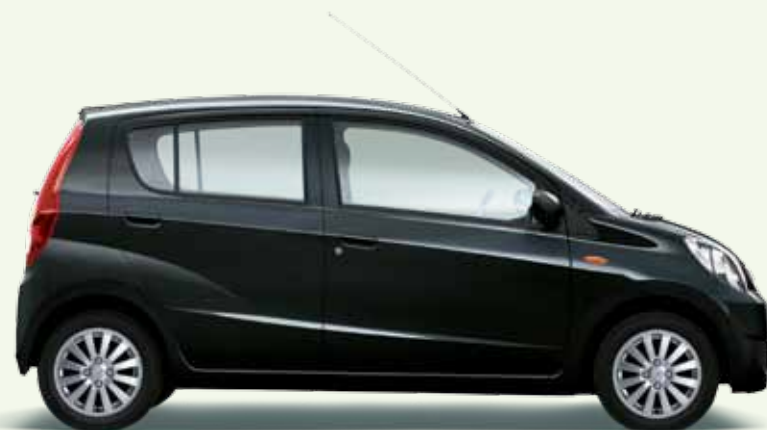
Noir Métal (X07)